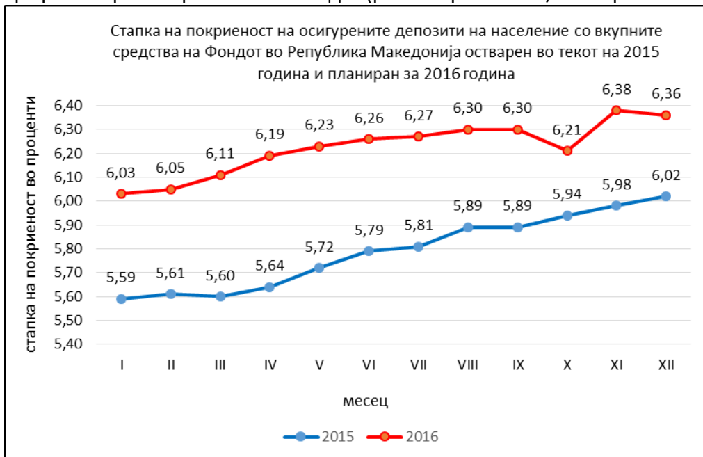
Графикон бр.2 Покриеност на Фондот (реализирано 2015/планирано 2016)