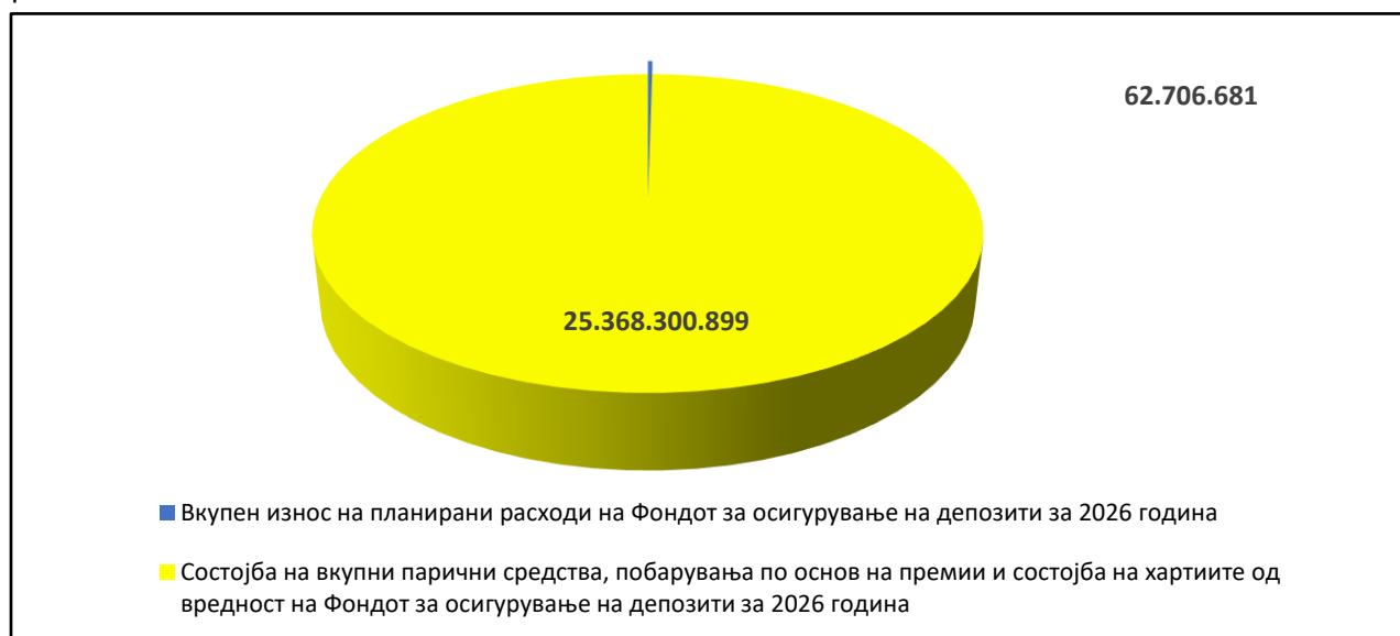
Figura 1. Shpenzimet totale të planifikuara për vitin 2026 në raport me bilancin e parave të gatshme totale, primeve të arkëtueshme dhe bilancin e letrave me vlerë të Fondit të Sigurimit të Depozitave për vitin 2026

Aktiviteti afarist i Fondit për vitin 2026 do të rezultojë në një efekt pozitiv: